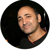
אבי בללי סרטים, מוסיקה ומה שביניהם.