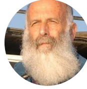
חיליק מגנוס המסע שלי. מרכז מבקרים יקב רמת הגולן