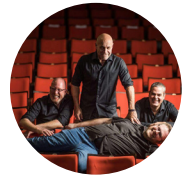
הופעה קומיקזה - כל הקודם זוכה